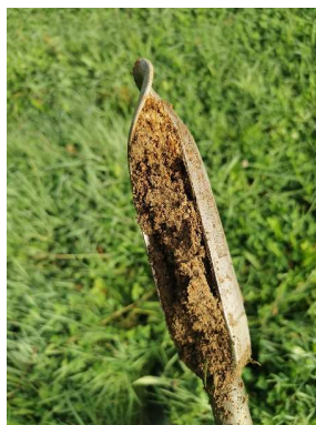
Carotte réalisée à 30-40 cm de profondeur

Conclusion : La parcelle ZD 282 ne présente pas de zone humide.