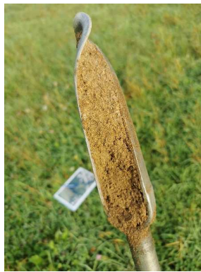
Carotte réalisée à 50-60 cm de profondeur